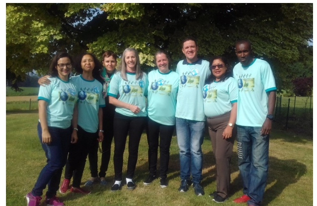
Brésil et Cap Vert (à droite)